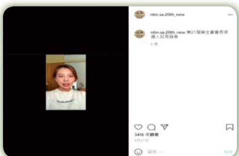
▲ 第21屆學生會會長候選人線上政見發表高達3416人次觀看