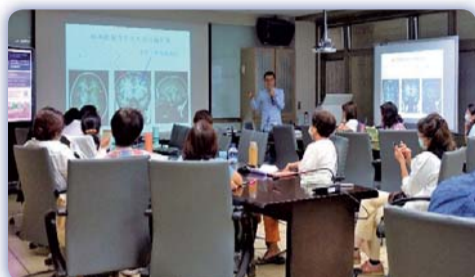
▲ 優雅的老年-大腦科學與心理科學如何幫助 COVID-19疫情下的高齡社會

榮大學、中華醫事科大、長庚科大、高雄醫學院、育英醫護專校、樹人醫護專校、美和科大、輔英科大等）；業界機構（含信福長照服務企業有限公司、臺南市私立順維居家長照機構、老人養護院及全日馨居家式照顧服務機構等），皆踴躍參與，透過研究中心掌舵，期望能達成躍升計畫長照領航之目標，引導有意願之教師、研究人員、及跨領域研究夥伴投入長照相關研究及跨域、跨校產學合作。