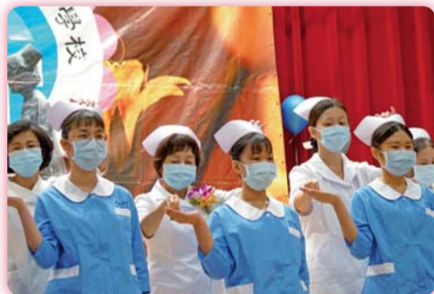
▲ 加冠儀式，「戴」上責任與期許