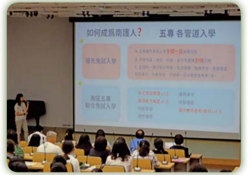
▲ 成為南護人~五專入學管道說明