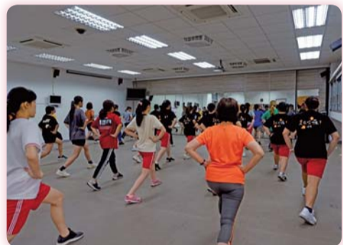
▲ 「94愛健康」運動課程，強化健康防護力及免疫力

5月立夏之際，疫情海嘯突發，臺灣並未在此波疫情中倖免，國內疫情警戒驟然升級，教育部宣布5月19日起改採線上教學，教學現場面對全新變革，透過網路打開另一扇學習的挑戰與視野。防疫會議密集召開，以因應疫情瞬息萬變，調整最佳備戰狀態。在COVID-19疫情逐步改變生活習慣的當下，沒有人能夠置身事外，量體溫、戴口罩、勤洗手、常消毒已然是生活日常，隨時關心自己及身旁親友同學，用溫暖的同理心，成為安定自己及他人的力量。疫情總有撥雲見日之時，讓我們能保有健康的身體，與內心的美好良善，逐步回歸防疫變革後的校園生活。