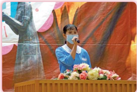
▲ 學生代表致詞：「感謝的心，感謝有您」

備基本的專業知識技能與即將邁出臨床實習的第一步，也代表著承擔護理專業的責任與使命；而師長導引傳光給學生，象徵護理專業知識、技能與素養的薪火相傳，傳遞愛與關懷。