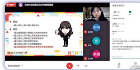
▲ 講者分享申請與執行要訣