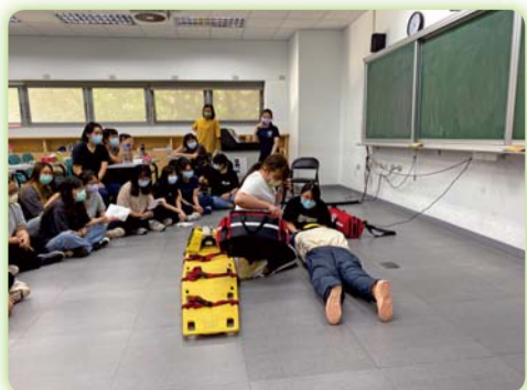
▲本科辦理初級救護技術員(EMT-1)訓練，指導學生實務的止血、包紮、頸椎固定術、脫除安全帽及上頸圍等相關課程，每組皆有指導員從旁提供協助。