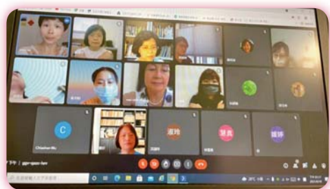
▲ 參加者線上參與畫面