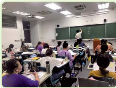
▲本科辦理社會工作師輔導班