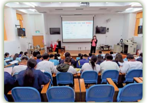
▲ 前往原住民部落國中宣導，學生踴躍聆聽及提問