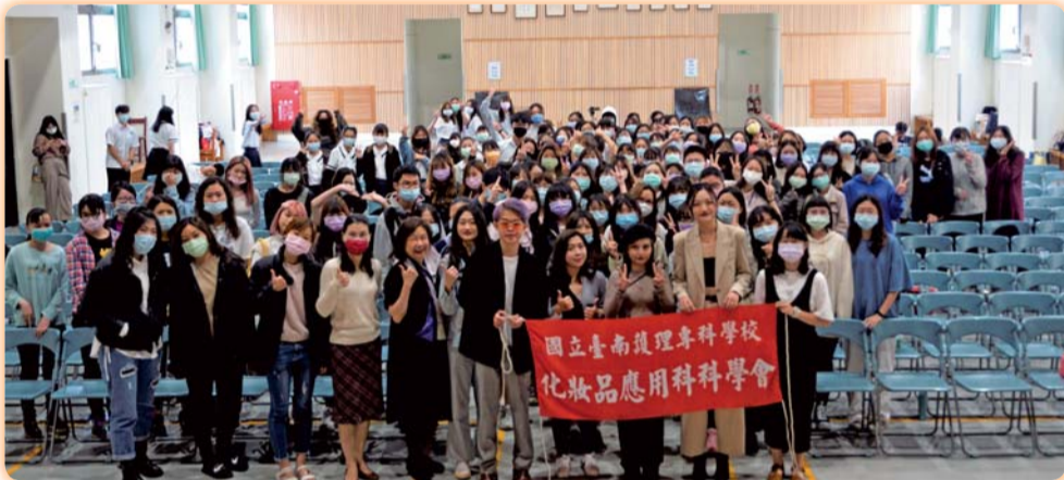
▲【妝品科校友回娘家講座】邀請「化妝品科技應用」及「美容保健與整體造型」兩大類別畢業校友踴躍返校參與活動，分享升學、求職及工作心得，有助本科學生個人生涯探索，並增進職場應具有的態度及技巧