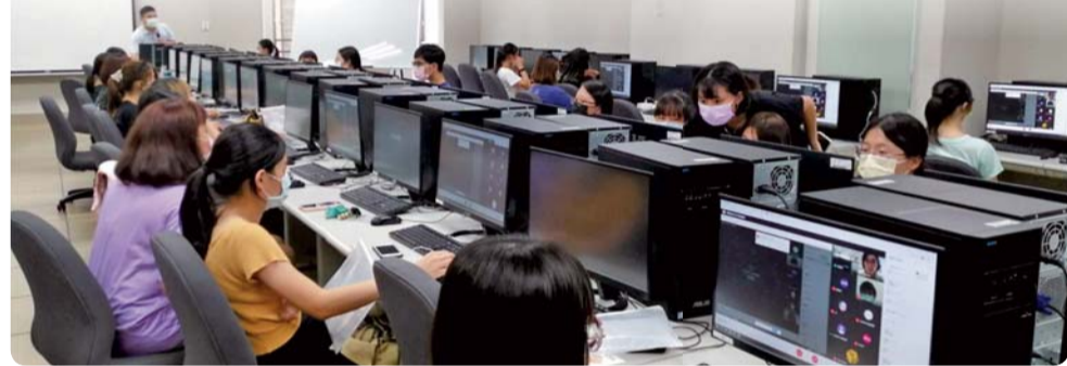
▲ 同步線上教學上課狀況

使用G-Meet，從預先建立會議、基本操作介面說明到讓參與者實際操作，及如何使用白板、便利貼、分享畫面等，以利本校教師能因應三級防疫，進行遠距教學。過程中教師及學生也積極的詢問、分享使用心得，與講者互動良好，講座整體平均滿意度4.45分（滿分5分）。