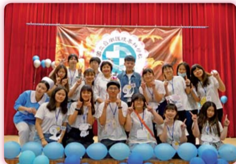
▲ 熱情開朗的第11屆幹部