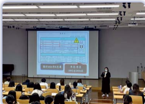
▲ 「履歷自傳撰寫」講座—提供求職者應徵履歷範例，並指導如何在文字敘述中展現個人特質