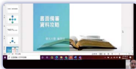
▲ 自傳與備審寫作攻略(升學用)

生升學備審、邁入職場所需資料整編，並由中心教師積極提供相關協助，此次本校學子申請北護書審表現不俗，最高達99.09分。