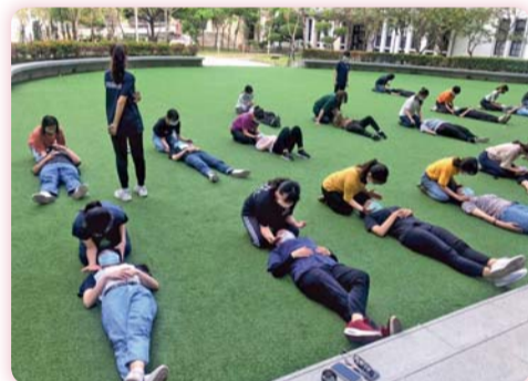
▲ 遵循防疫原則下，辦理「初級救護技術員（EMT-1）輔導課程」