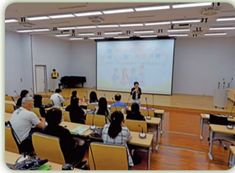
▲ 五專入學說明會開幕式-校長致詞