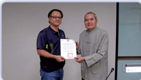
▲ 科技部申請要訣分享致贈感謝狀

師的學術研究能量，讓不同領域的教師熟悉計畫申請的流程及注意事項，希望對本校教師在科技部研究計畫的通過率有所助益。