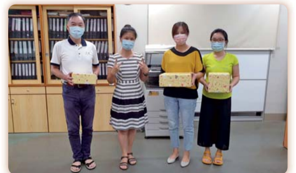
▲110年度人事主任與專書閱讀心得寫作得獎同仁合影