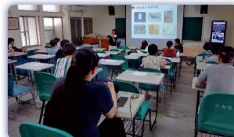
▲ 創意教學策略於臨床問題研發