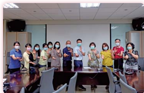
▲ 同仁踴躍參與講座活動

法，有系統地搜索、分辨、選擇、評價和綜合與研究主題等相關資料，進而從自身研究出發，分享跨領域結合及systematic review之訣竅，藉此增進本校教師學術研究量能。