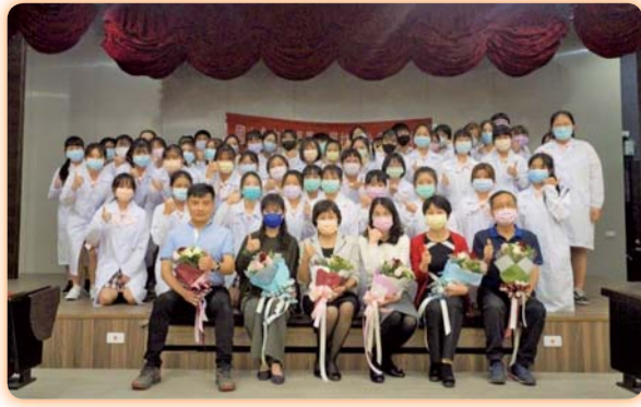
▲妝科會舉辦第二屆授服活動，由校長及教師幫學生披上繡有自己名字的實驗白袍，象徵化妝品科技教育的起始，正式踏入專業學習領域