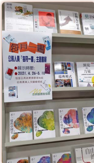
▲110年度每月一書主題書展

期盼透過多項閱讀、寫作、數位學習競賽等活動，激發本校教職員工學習潛能及強化數位學習，營造出樂活學習之校園環境。