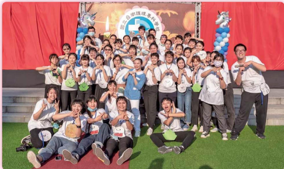
▲ 活力四射的第10屆幹部