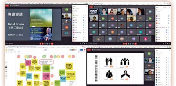
▲「第二座山」專書閱讀線上導讀會活動