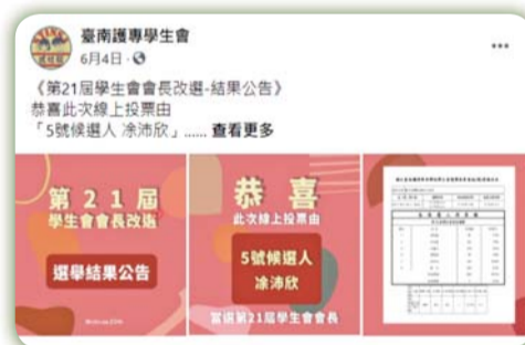
▲ 線上公告第21屆學生會會長選舉結果