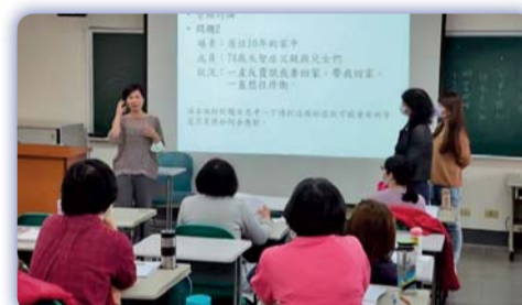
▲ 失智症照護研習班-情境分析及討論