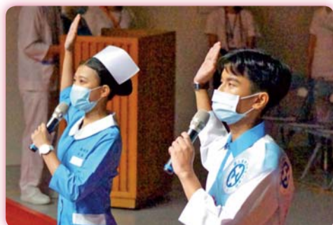
▲ 宣揚南丁格爾誓詞

護理科為獎勵學生於臨床實習表現優異，訂有護理百合天使甄選辦法，經遴選選出代表本科實習最高榮譽的護理百合天使。