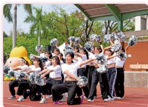
▲ 110年度全校運動會開幕典禮啦啦舞表演

109年度因嚴重特殊傳染性肺炎（COVID-19）影響，全校運動會停辦。今年度全校師生帶著期待及雀躍的心情，迎接本校一年一度盛事，並在國立臺南大學支持與協助下順利辦理完成。本次參賽選手無不使出渾身解數，積極爭取佳績。今年亦首度舉辦趣味變裝大隊接力，展現南護學子的熱情活力與創意無限。