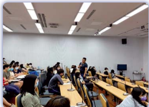
▲ 「就業歧視、性平法暨求職防騙自我保護」講座—講師在課堂中與同學進行雙向溝通，協助同學解答疑問