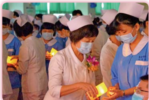
▲ 傳遞護理希望之光