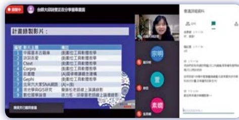
▲ 教學實踐績優講座

教學實踐計畫績優教師，於線上分享教學實踐計畫申請要訣與數位人文課程，是一場跨校際、跨領域的精采講座。