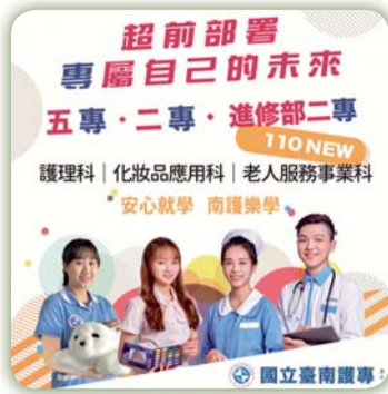
▲ 網路BANNER媒體搜尋廣告