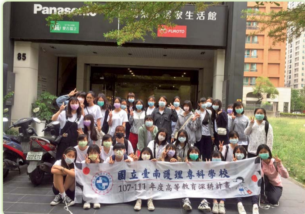
▲本科學生至福樂多 FURUTO 銀髮生活館參訪，透過導覽人員介紹學生可以看到輔具運用在不同地方時可以發揮到最大的效能